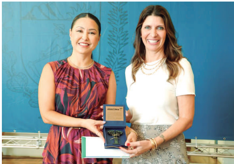
Colombo recebe reconhecimento por sua excelência na luta contra a dengue. Destaque na mobilização comunitária e ações premiadas impulsionam o município para a vanguarda da saúde pública.

"Quero parabenizar a nossa primeira-dama, Luciana, pela iniciativa e por caminhar ao lado do nosso governador, Ratinho Júnior, e juntos cuidarem com tanta dedicação e carinho do povo do Paraná. Esse prêmio é fruto do trabalho de uma grande equipe que se uniu na eliminação