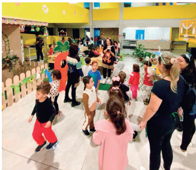
Celebração e aprendizado, alunos mergulham na experiência do acantonamento durante a Magia de Páscoa na Escola Interativa, fortalecendo laços e criando memórias inesquecíveis.

A abordagem pedagógica adotada durante o evento seguiu os princípios da pedagogia Freinet Célestin, que valoriza a participação ativa dos alunos no proces-