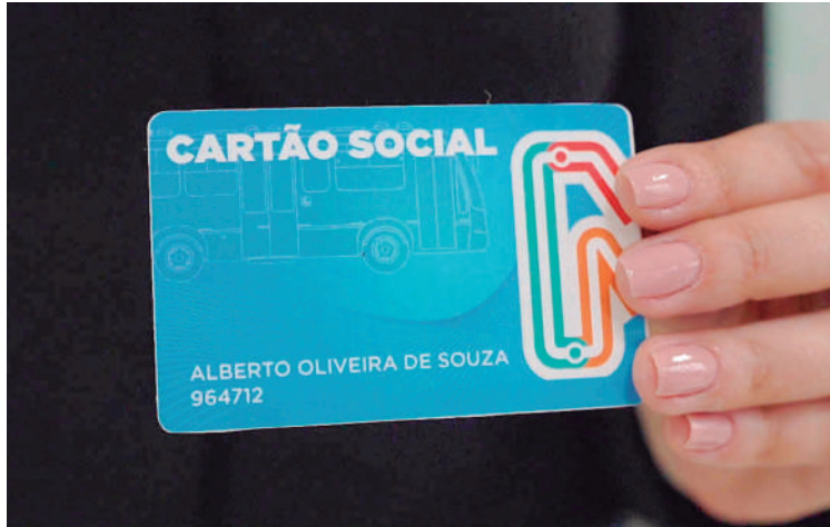
Promovendo inclusão e oportunidades, Cartão Social do Paraná facilita o acesso ao emprego para indivíduos de baixa renda, fornecendo suporte essencial ao transporte.

Entretanto, para se qualificar para o programa, existem alguns critérios a serem atendidos. Os interessados devem estar cadastrados no Cadastro Único para Programas Sociais do Governo Federal (CadÚnico) e no Sistema Nacional de Emprego (Sine). Além disso, devem atender a critérios es-