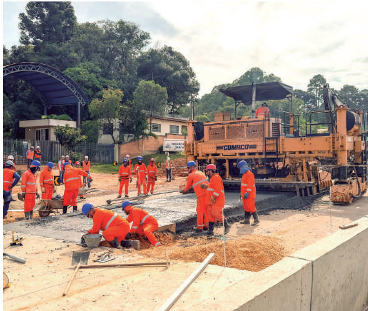
Duplicação da Rodovia dos Minérios rumo à fase final, previsão de conclusão em setembro. Frentes de trabalho pavimentam pista central e vias marginais.

O início da duplicação se dá próximo ao viaduto do Contorno Norte de Curitiba (PR-418) e se estende por