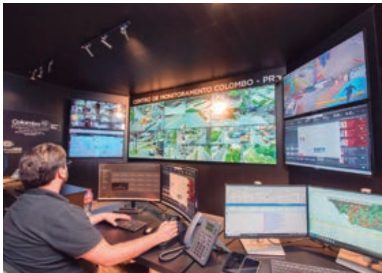
Prefeitura de Colombo implementa programa de segurança inovador, integrando tecnologia e proteção urbana.

Com quase mil câmeras instaladas em pontos estratégicos e acesso gratuito à internet para a população, o principal objetivo é garantir