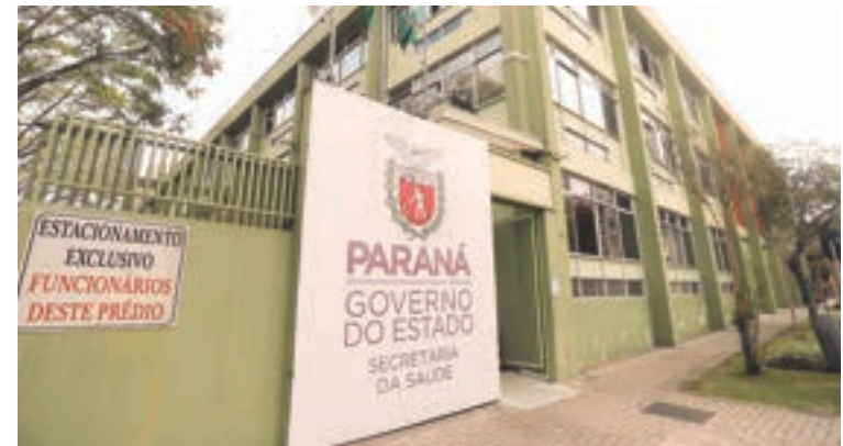
Decreto publicado segunda-feira (26) indica que medicamentos comprovadamente seguros e eficazes pela Anvisa poderão ser incluídos na lista da Secretaria de Saúde.

Atualmente, apenas um medicamento com canabidiol e tetrahidrocannabinol é registrado pela Anvisa, indicado para tratar a espasticidade moderada a grave na esclerose múltipla. Espera-se que mais medicamentos sejam aprovados, expandindo as opções terapêuticas.